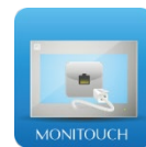
【アイコンイメージ】